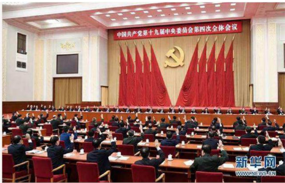
党的十九届四中全会

今年是党的十九届四中全会提出“坚持和完善中国特色社会主义制度、推进国家治理体系和治理能力现代化”之后的开局之年，因此疫情防控工作对我国国家治理体系和治理能力是一次集中考验，对于我们能否将十九届四中全会概括的中国特色社会主义制度优势转化为治理效能也是一次集中检验。