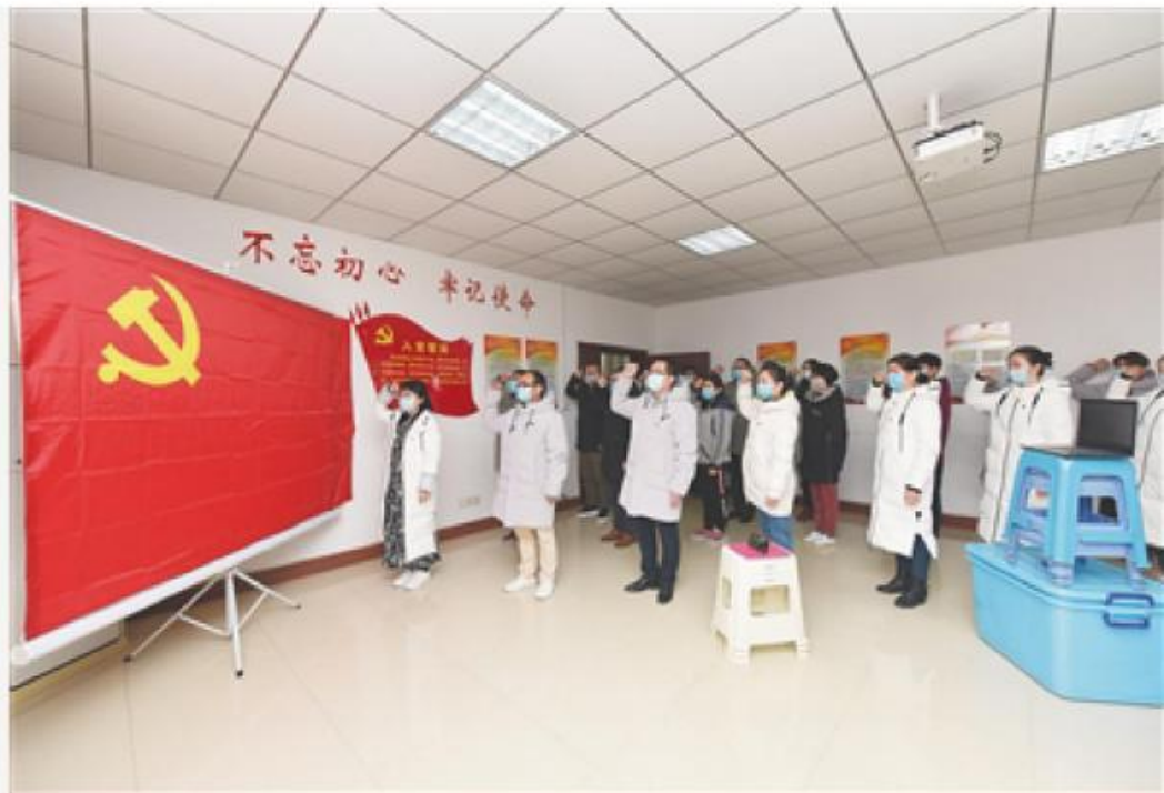
3月2日，在湖北省荆州市中医院的党员活动室，24名医护人员面向鲜红党旗，进行入党宣誓。

第五，普通党员群众积极投入疫情防控过程中。 在疫情严峻之时，共产党员总是挺身而出，坚定站在疫情防控第一线。哪里任务险重，哪里就有党组织坚强有力的工作，哪里就有党员当先锋作表率。在新闻媒体上，我们看到有的群众在党员先锋模范作用带动下，递交了入党申请书；有的治疗队在疫区组织了新党员入党宣誓仪式。