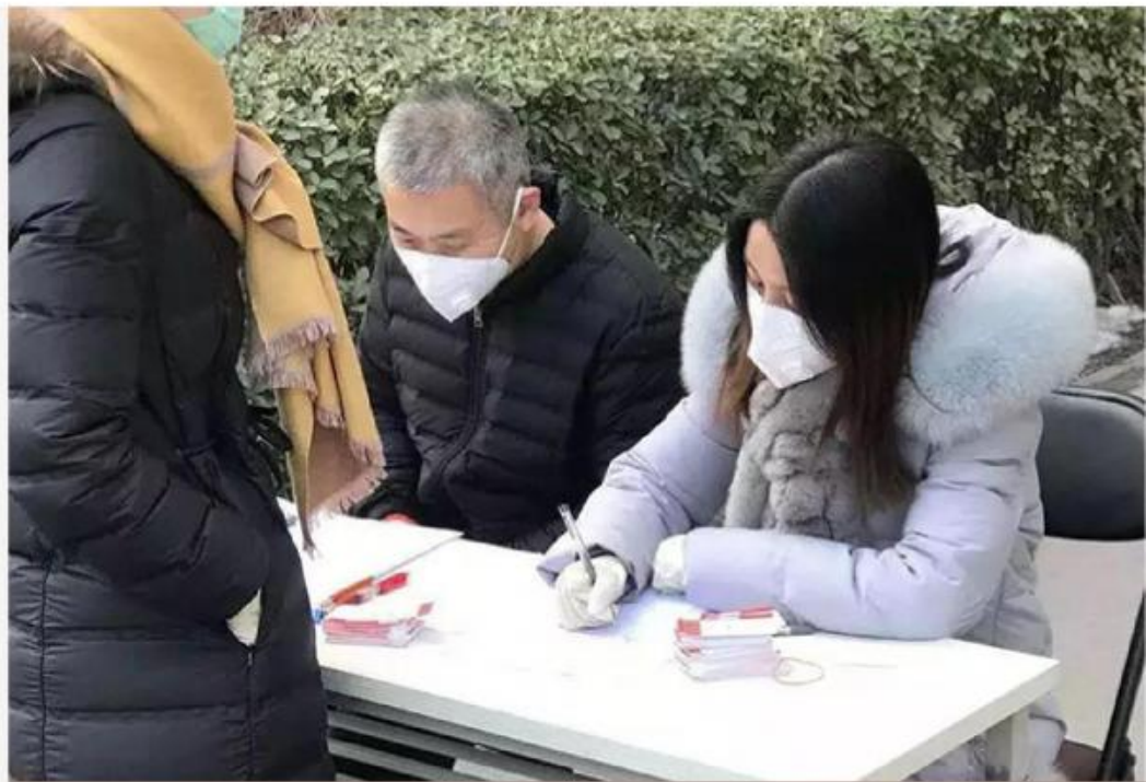
社区基层工作者开展防疫工作

第四，基层党组织雷厉风行。 各级党组织和广大党员干部充分发挥战斗堡垒和先锋模范作用，坚定站在疫情防控第一线，打头阵、作先锋，全面落实防控措施。在新闻中，在网络上，我们可以看到，基层党组织全部行动起来，有的成立疫情防控后勤保障队，有的成立疫情防控爱心团队。