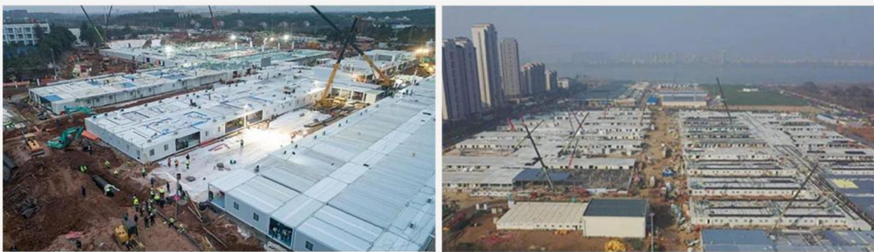
火神山、雷神山医院